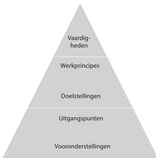
Figuur 1.3 Vijf elementen van methodisch werken

De wijze waarop je inhoud geeft aan je methodisch handelen – de methode die je gebruikt of de methodiek die je volgt – kan verschillen van de wijze van werken van een ander. De inhoud van methodisch werken wordt beïnvloed door wat je kunt, wat je weet en door je inzicht. Kennis, kunde en vaardigheid zijn uiteindelijk ook componenten die jouw visie vormgeven. Je zult begrijpen dat jouw ontwikkeling als professional daarom ook van invloed zal zijn op jouw methodisch werken. Ook de uitgangspunten van waaruit je werkt en je vooronderstellingen zijn elementen die inhoud geven aan jouw manier van methodisch werken. Misschien pak je volgend jaar de zaken heel anders aan omdat je visie inmiddels verder is ontwikkeld. Je handelen en je praktijkervaring geven je veel informatie, en je vermogen tot reflectie geeft je de mogelijkheid die ervaring bij te sturen.